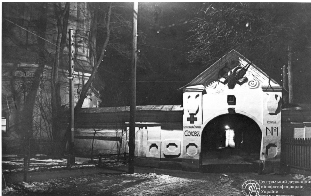
Військовий шпиталь № 1 у Кирилівській лікарні під час Першої світової війни.